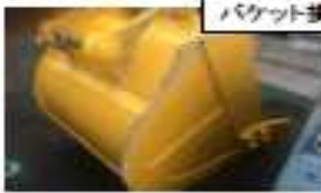
バケット損傷状況と落下場所