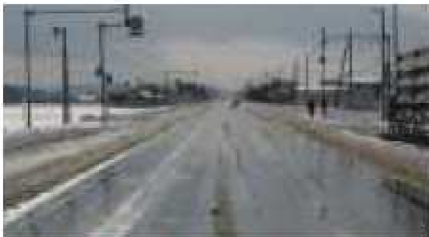
湿潤、凍結した道路