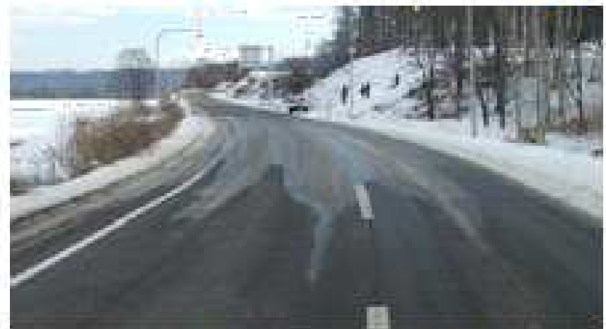
一部凍結した道路