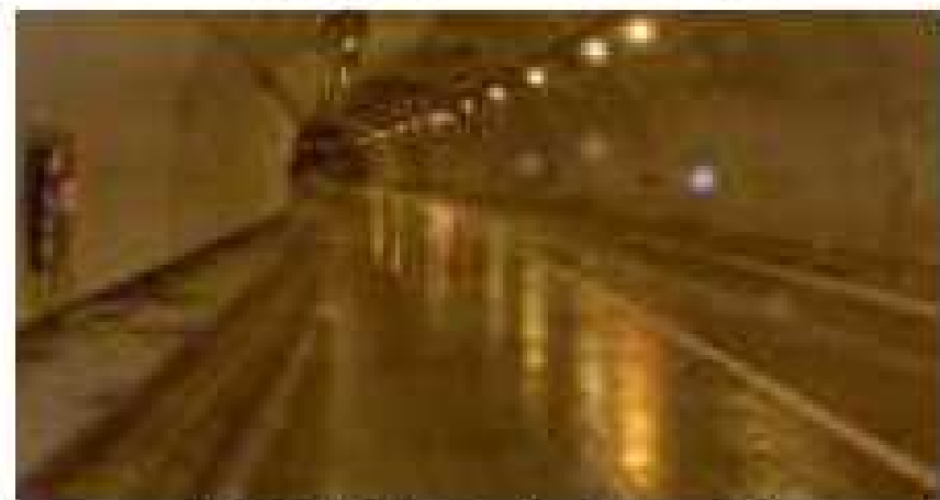
一部凍結したトンネル