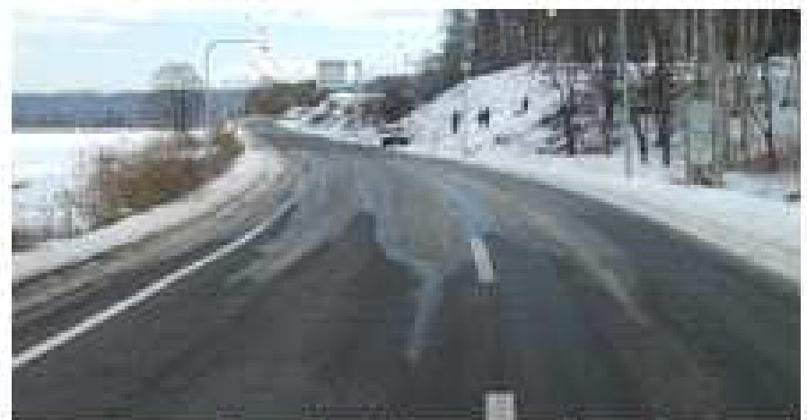
一部凍結した道路