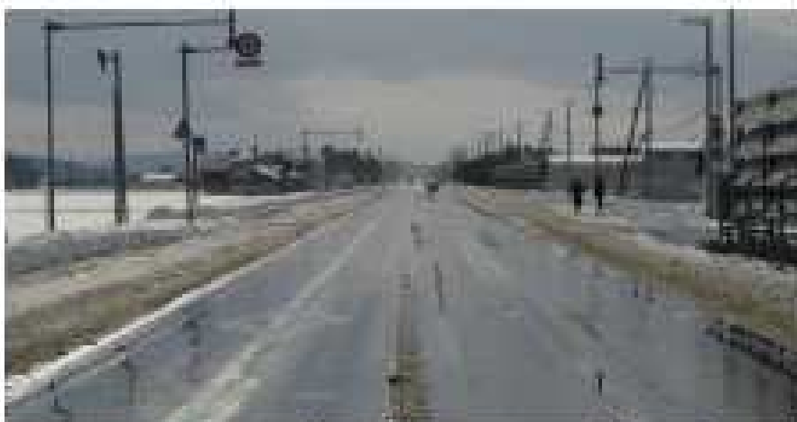
湿潤、凍結した道路