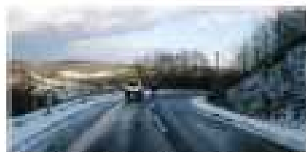
山間部のカーブでの全面凍結。