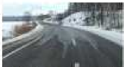
樹林による日陰のため、一部凍結路面が発生。