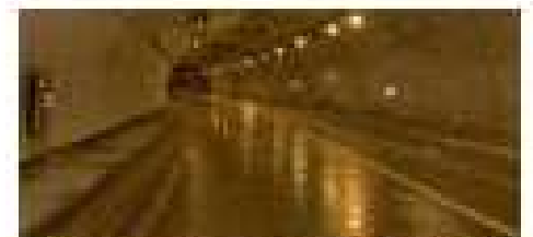
トンネルの手前は乾燥しているが、トンネル内の出入口付近が一部凍結。