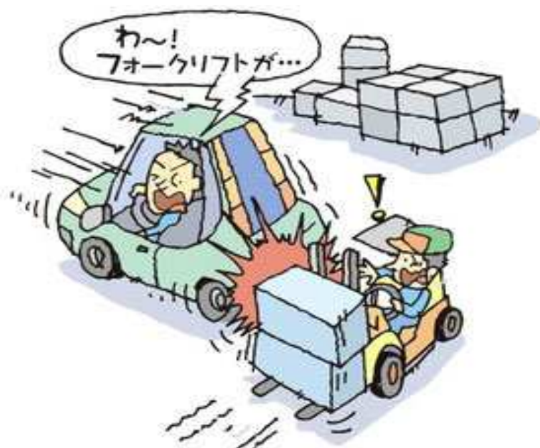
後ろに止っていた車に衝突