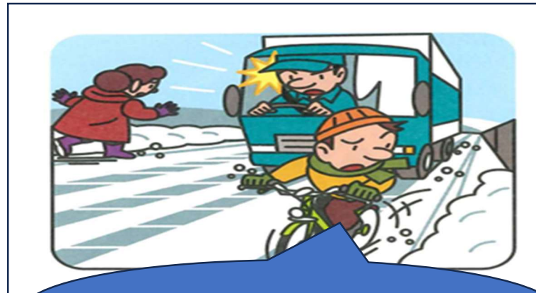
道路わきの自転車！