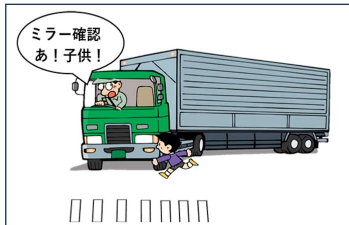
死角に人・自転車が