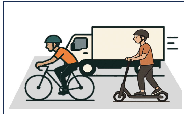
自転車とは大きく空ける